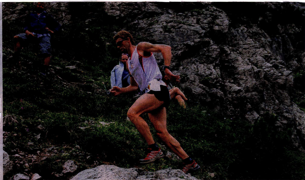
15 Kilometer und 853 Höhenmetern erwarten die Teilnehmer beim Widderstein-Lauf.