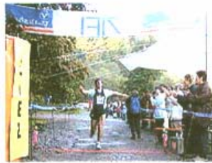
Im Ziel: Erlösung nach 850 Höhenmetern und 16 km.