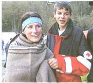
Die Walser Rettung hüllte die LäuferInnen in warme Decken.