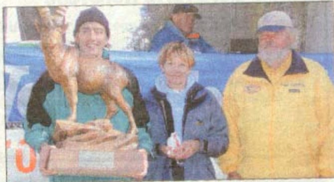
Die Tagessieger des zweiten Widdersteinlaufs.

Die Organisatoren vom Tri-Team Kleinwalsertal rund um Seppi Neuhauser hatten die Tage zuvor alle Hände voll zu tun: Der Streckenverlauf musste markiert, gesichert und am Tag davor teilweise noch freigeschaufelt werden. Schließlich nahmen am Sonntag exakt 81 Läufer(innen) bei leichten Minusgraden die