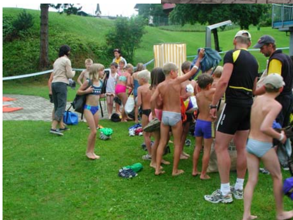
Aufregung vor dem Schwimmstart