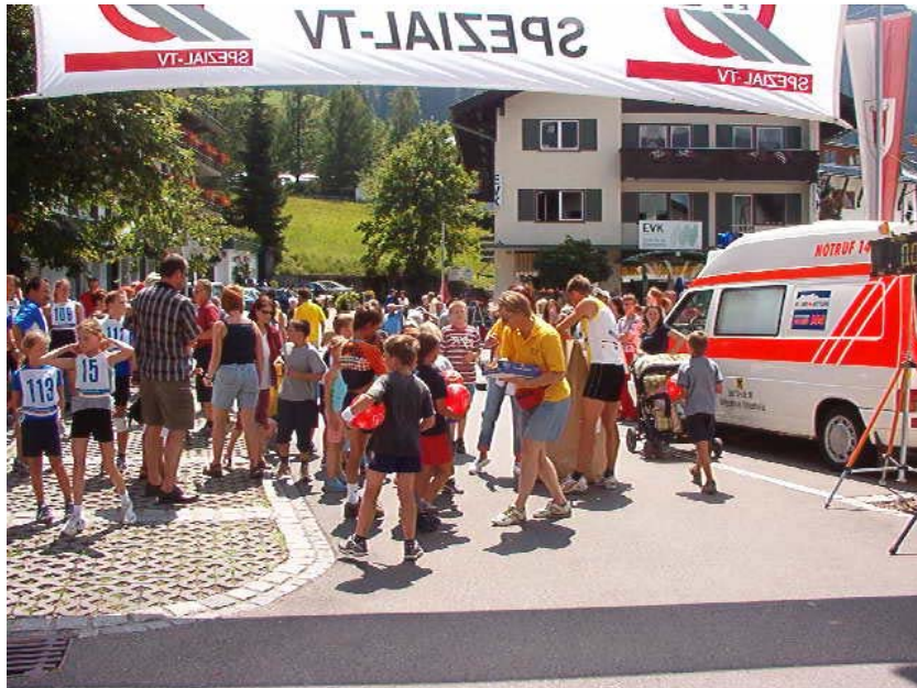
Kurz vor dem Start der Kinder

Bei strahlendem Wetter aber dafür drückender Hitze fand im Rahmen des Sommerfestes der Walser Rettung der 2. Stundenlauf vom Tri-Team statt. Vor dem Hauptlauf bewiesen zuerst ca. 20 Kinder abwechselnd laufend zehn Minuten lang ihr Ausdauervermögen; alle Achtung vor ihrem vollen Einsatz.