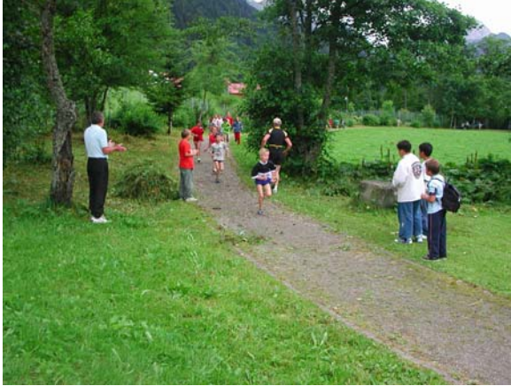
Gleich sind wir im Ziel