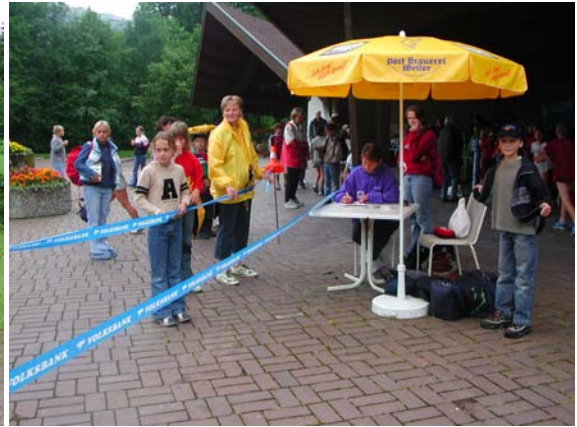
Wer wird wohl der erste sein ?