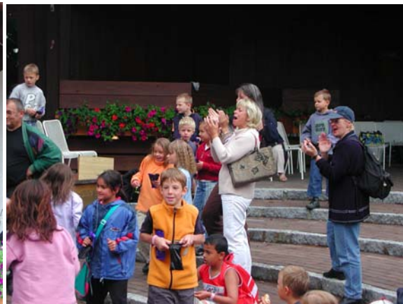
Auch die Lehrerschaft war mit dieser Veranstaltung zufrieden, wie man an den Gesichtern sehen kann.